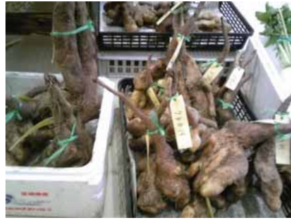
一押し商品「自然薯」