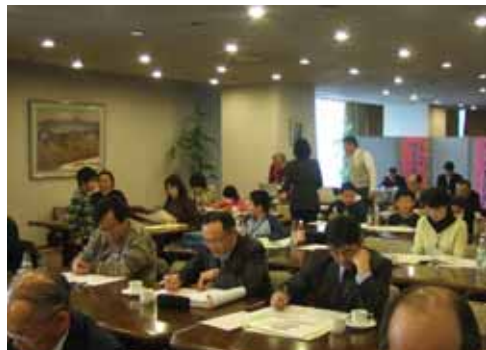
第12回交流大会～熱心に選考する参加者～

恒例の第13回日本ことば遊び回文コンテスト・交流大会、郵送の部」の応募を昨年12月31日に締め切りました。今回は、北は秋田県、南は福岡県まで各地から昨年より69点多い326点の作品を受付けました。今回は新たに読みが13字以内のシンプル文部門を創設したほか、作並温泉賞の部を部門として創設。その結果、シンプル文の部と句の部それぞれ77点、歌の部38点、自由の部84点、作並温泉賞の部21点、チビツ子の部29点の応募となりました。