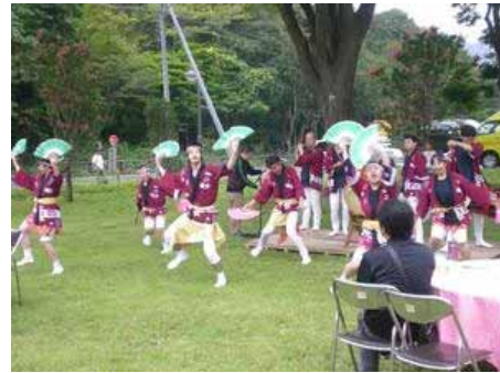
一の坊すずめ連の仙台すずめ踊り