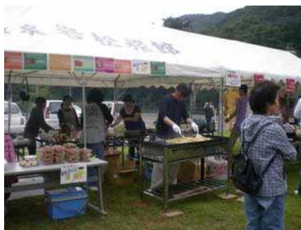
作並温泉B級グルメ屋体