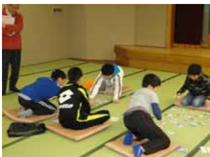
熱く戦うかるた戦士たち

応募があつた作品は、1月23日(土)に回文の里づくり実行委員会による予備審査を経て、第13回交流大会参加者が審査する第1次審査に進みました。そして、その結果を受けて、恒例の第13回日本ことば遊び回文コンテスト・交流大会、郵送の部」の応募を昨年12月31日に締め切りました。今回は、北は秋田県、南は福岡県まで各地から昨年より69点多い326点の作品を受付けました。今回は新たに読みが13字以内のシンプル文部門を創設したほか、作並温泉賞の部を部門として創設。その結果、シンプル文の部と句の部それぞれ77点、歌の部38点、自由の部84点、作並温泉賞の部21点、チビツ子の部29点の応募となりました。