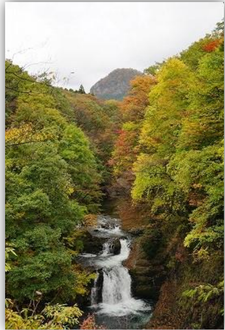
写真2 ほうめいしじゅうはちたき 鳳鳴四十八滝