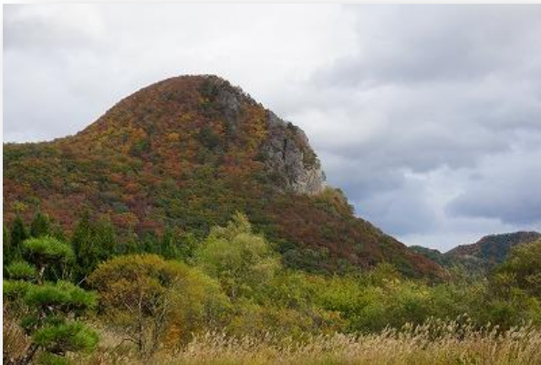
写真1 かまくらやま 鎌倉山(通称：ゴリラ山)